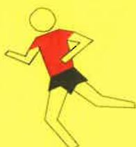
Course à pied