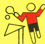
Tennis de table