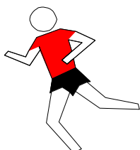
Course à pied