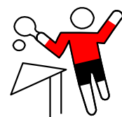
Tennis de table